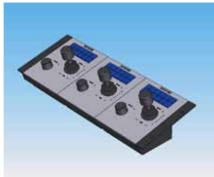
三个控制面板安装在19英寸机架上