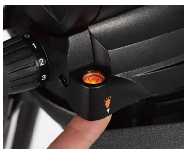
发光式水平校正器

此云台配备了很多易于操作的组件，包括连续可调阻尼旋钮，水平俯仰锁扣，快速释放的摄像机滑板，以及其他配件，例如发光式水平校正器和可伸缩手柄。